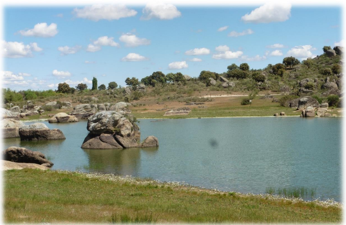
Enorme, als door beeldhouwers kunstzinnig gevormde rotsblokken creëren een haast surrealistisch landschap. Deze rotsen zijn in de loop van 575 miljoen jaar gevormd uit de laag